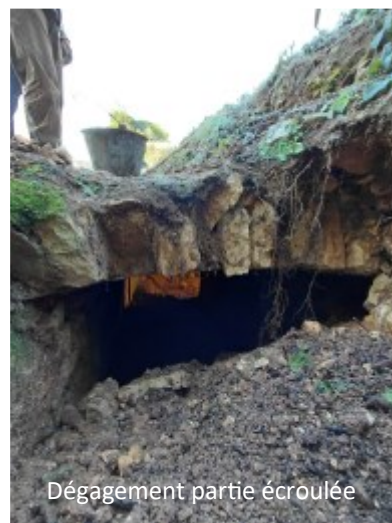
Dégagement partie écroulée

C'est à la main que les seaux étaient montés car ils ne nous avaient pas laissé installer le treuil dont nous avions parlé dans un précédent bulletin. Dimanche après la messe de fin de matinée nous leur avons fait découvrir la maison du Patrimoine et offert du vin chaud et quelques mignardises. Ils ont quitté Pranzac dès 14h pour retrouver leur domicile. Le prochain chantier de jeunes est prévu pour le WE du 8 mai avec ARCADE