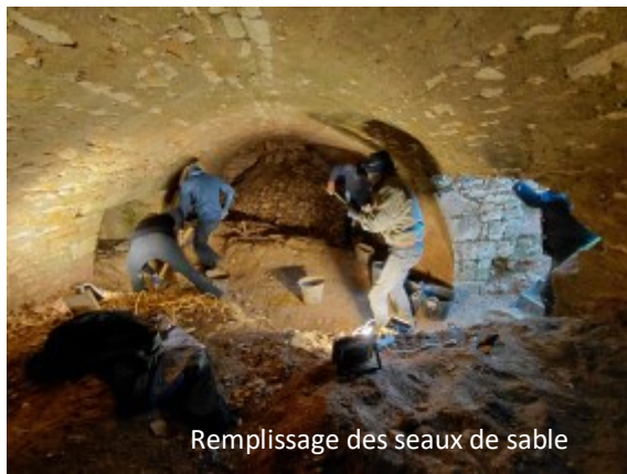
Remplissage des seaux de sable