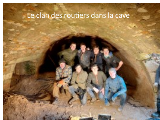
Le clan des routiers dans la cave

C'est à la main que les seaux étaient montés car ils ne nous avaient pas laissé installer le treuil dont nous avions parlé dans un précédent bulletin. Dimanche après la messe de fin de matinée nous leur avons fait découvrir la maison du Patrimoine et offert du vin chaud et quelques mignardises. Ils ont quitté Pranzac dès 14h pour retrouver leur domicile. Le prochain chantier de jeunes est prévu pour le WE du 8 mai avec ARCADE