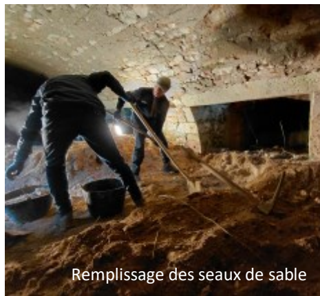
Remplissage des seaux de sable