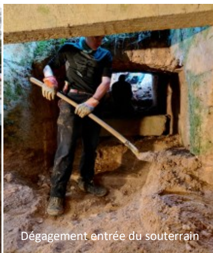
Dégagement entrée du souterrain