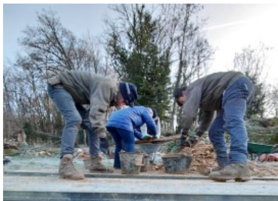
Les seaux en surface avant tamisage