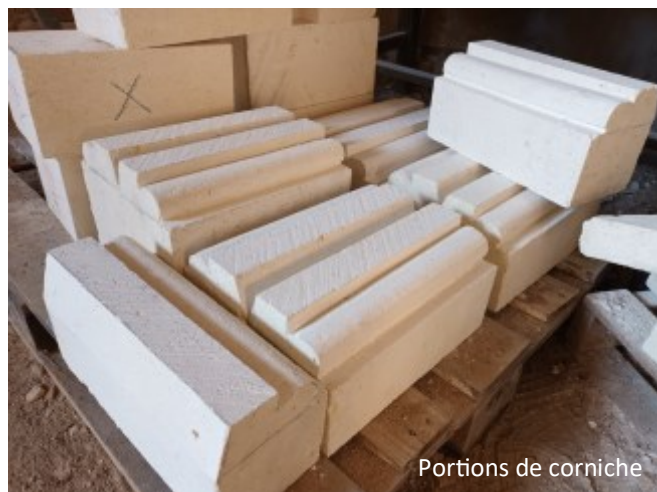
Portions de corniche