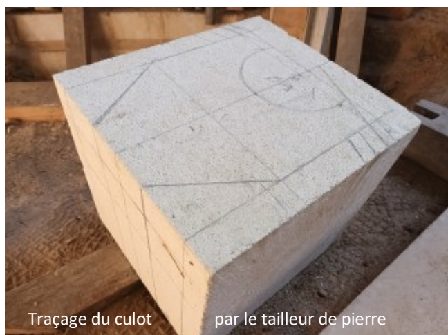
Traçage du culot par le tailleur de pierre