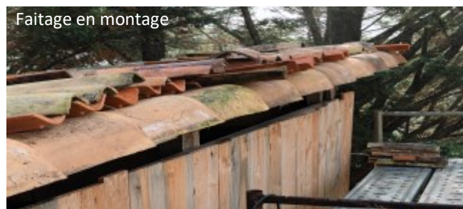
Faitage en montage

Le faîtage est l'une des dernières opérations sur la toiture du Préau. Jacky a vissé chaque tuiles du faîtage et pendant ce temps là Alain a positionné la portion de dalle en bois situé au dessus de la porte d'accès au fournil. Une chaîne va permettre à l'eau de pluie de descendre d'un étage jusqu'à une autre dalle située 30 cm plus bas. Merci à Alain pour ces réalisations.