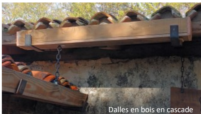
Dalles en bois en cascade