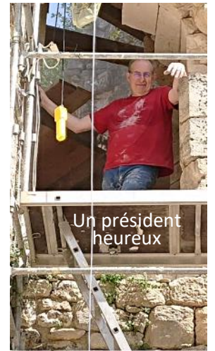
Un président heureux

Les versements de dons effectués jusqu'à ce jour vont permettre l'achat de 80 nouvelles pierres. Avez-vous participé à cette démarche ? Si oui merci mais il sera possible de faire un don défiscalisé tout au long de l'année sur HelloAsso.