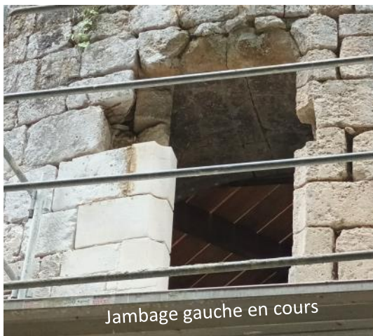
Jambage gauche en cours