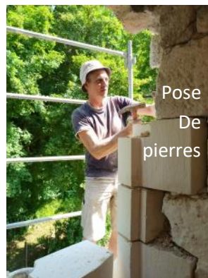
Pose De pierres