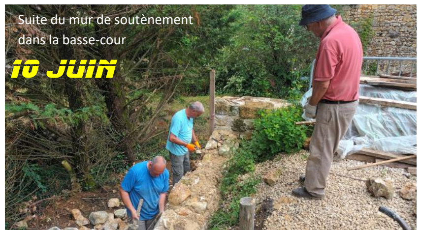
Suite du mur de soutènement dans la basse-cour