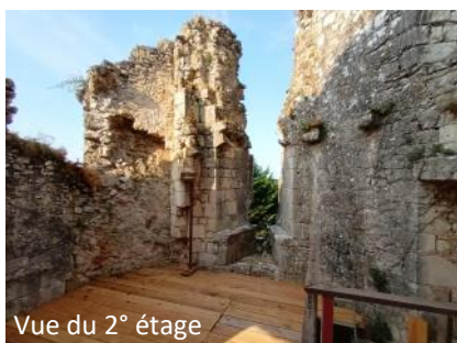
Vue du 2° étage