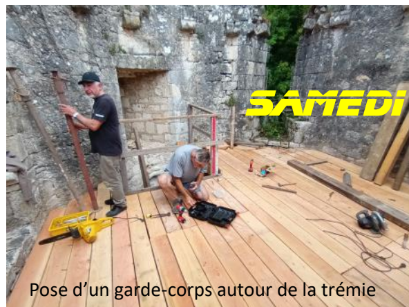
Pose d'un garde-corps autour de la trémie