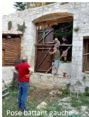
Pose battant gauche