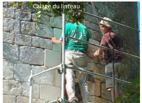
Calage du linteau