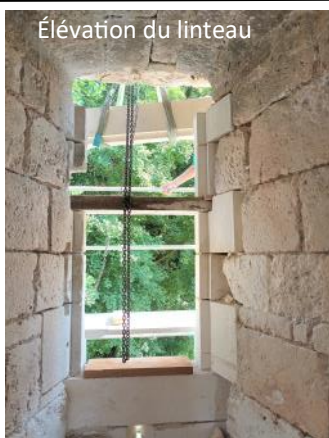
Élévation du linteau