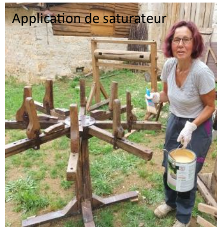
Application de saturateur