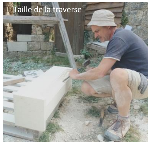
Taille de la traverse