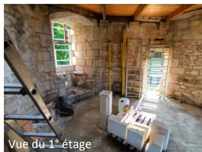
Vue du 1° étage

C'est le jour de la fête de la musique que le linteau et la traverse de la fenêtre coté parc ont été posés avec l'aide d'un palan fixé à l'étage supérieur. Le tailleur de pierre était assisté de Marcel, Alain et Jean Luc. La suite va consister à la restauration d'un coussiège et des ébrasements.