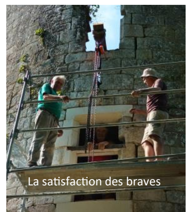
La satisfaction des braves