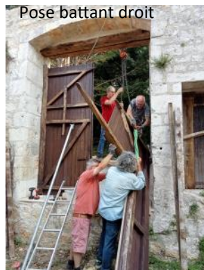
Pose battant droit

Une matinée a suffi à adapter et mettre en place le très beau portail de récupération.