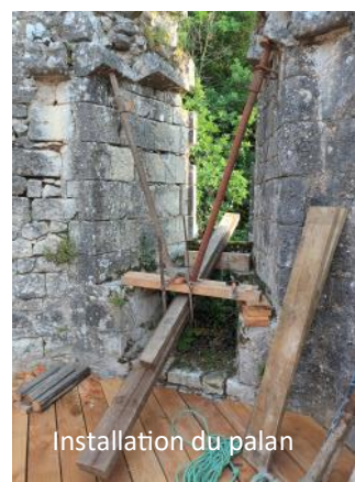
Installation du palan