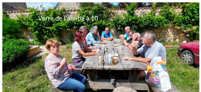
Verre de l'amitié à 10