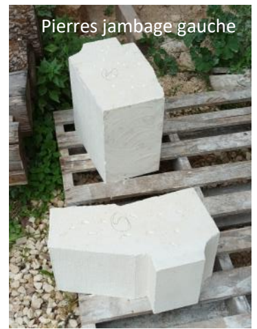
Pierres jambage gauche