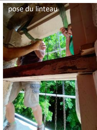
pose du linteau