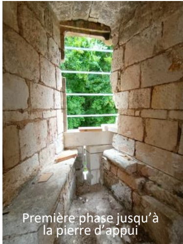
Première phase jusqu'à la pierre d'appui

C'était au tour de la seconde fenêtre du premier étage coté ancien parc de recevoir les nouvelles pierres en tableau puis les grosses pierres de linteau et de traverses de plus de 100 Kg chacune. Pour cela l'échafaudage extérieur avait été surhaussé au préalable. C'est une équipe de 3 gars costauds qui accompagne le tailleur de pierre pour ces manœuvres. La dizaine de pierres sur cette fenêtre a nécessité un budget d'achat d'environ 250€ soit 25€ la pierre brute avant la taille.