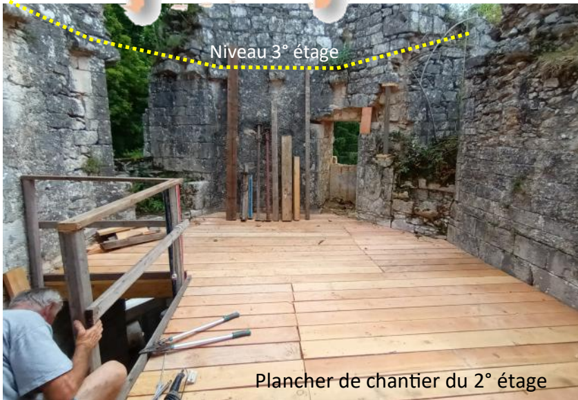
Niveau 3° étage