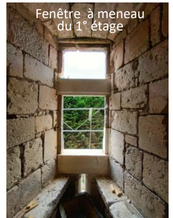
Fenêtre à meneau du 1° étage