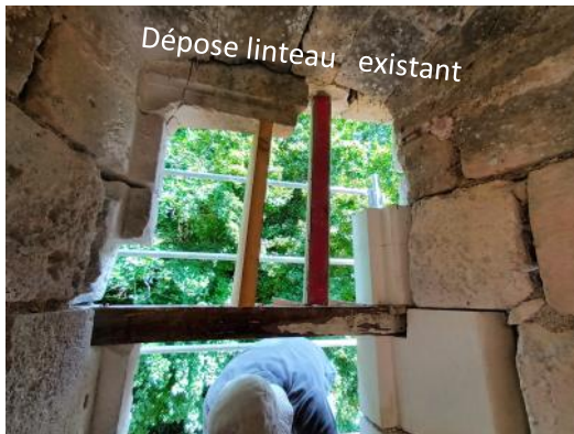
Dépose linteau existant