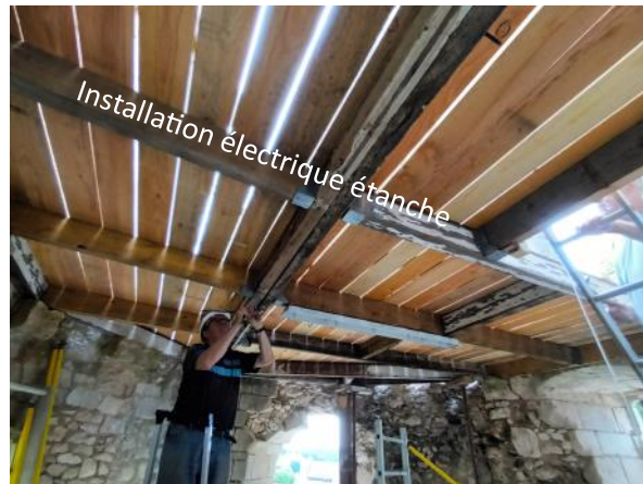
Installation électrique étanche

La matinée s'est terminée par le verre de l'amitié bien méritée.