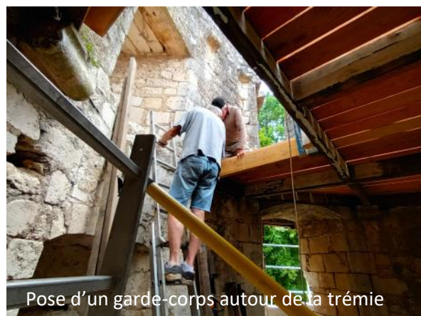
Pose d'un garde-corps autour de la trémie