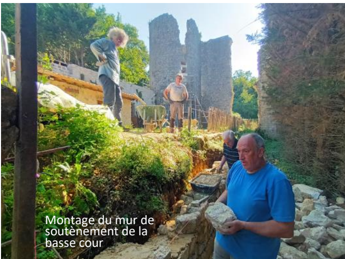
Montage du mur de soutènement de la basse cour