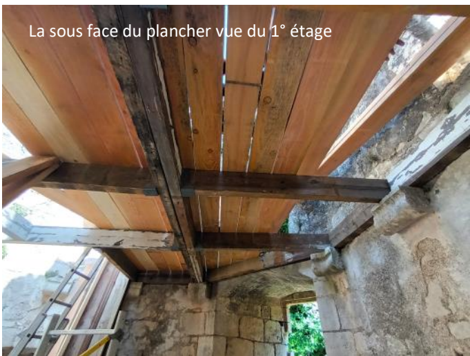
La sous face du plancher vue du 1° étage