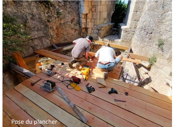
Pose du plancher