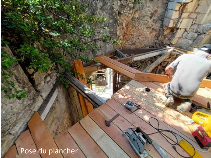
Pose du plancher