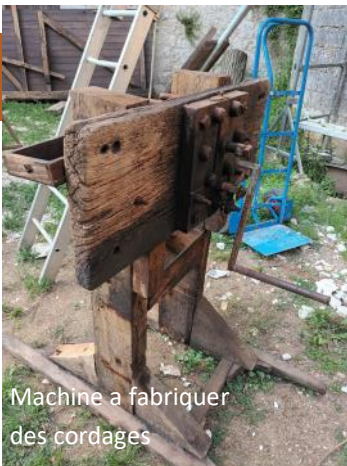
Machine a fabriquer des cordages