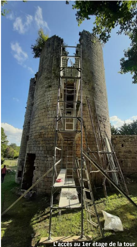
L'accès au 1er étage de la tour