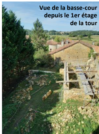
Vue de la basse-cour depuis le 1er étage de la tour

Pas moins de quatre échafaudages ont été monté sur le site du château ces dernières semaines.