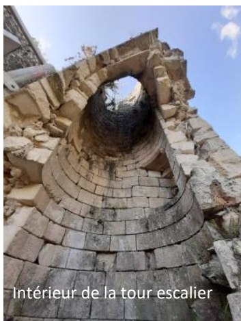
Intérieur de la tour escalier