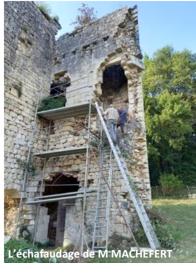
L'échafaudage de M MACHEFERT