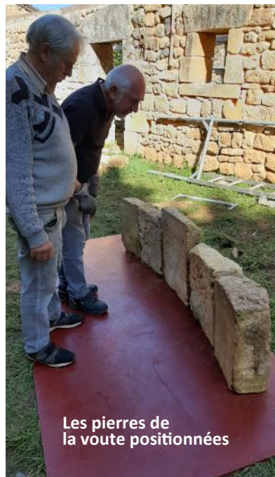
Les pierres de la voute positionnées

Le troisième échafaudage est celui fourni par l'entreprise de peinture LARPE et qui a été posé dans la maison par leurs ouvriers pour nous permettre la semaine prochaine de procéder la suite de la pose de la charpente.