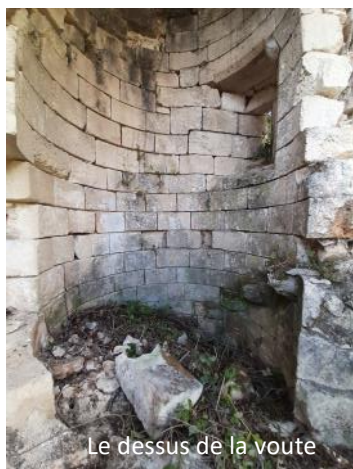
Le dessus de la voute

La tour escalier a été dégagé ce week-end des ronces et le dessus de la voute a commencé à faire l'objet d'un début de dégagement des pierres qui encombraient le dessus de la voute du rez de chaussée.