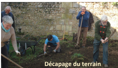
Décapage du terrain