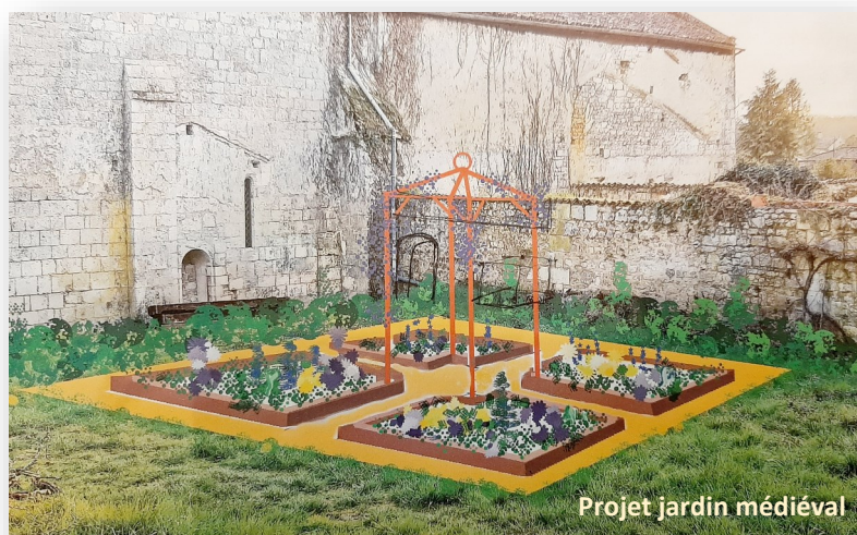
Projet jardin médiéval

Voici le site fin 2020, depuis les niveaux de gradins pour les futurs son et lumière, avec l'église et la chapelle à gauche, le logis Renaissance au centre en arrière plan et les vestiges des deux tours médiévales à droite. La toute première action se situe dans l'axe du logis