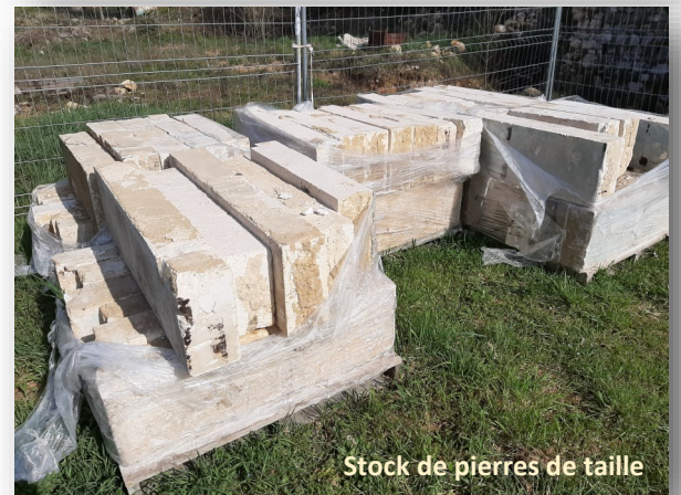
Stock de pierres de taille