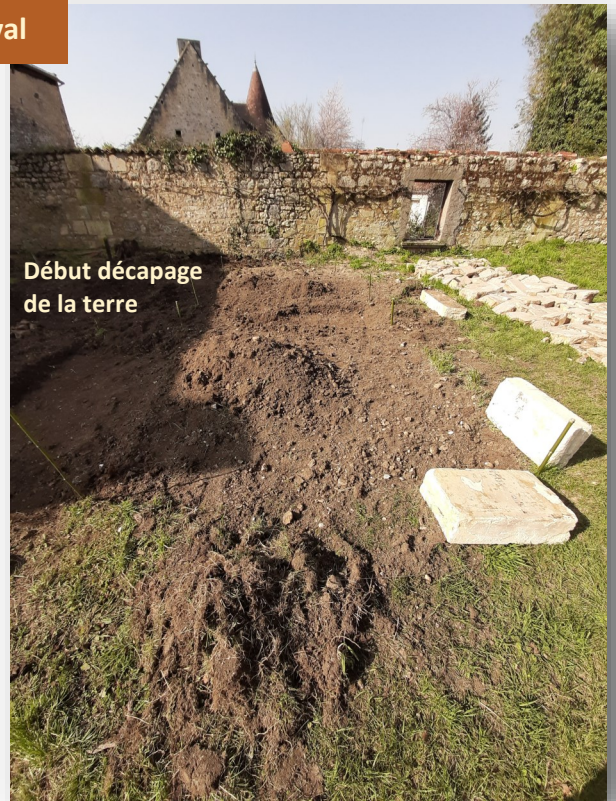
Début décapage de la terre

Vous pouvez rejoindre nos équipes sur les chantiers participatifs en téléphonant au 05 52 23 52 61. Toutes les bonnes volontés sont acceptées même sans formation particulière.