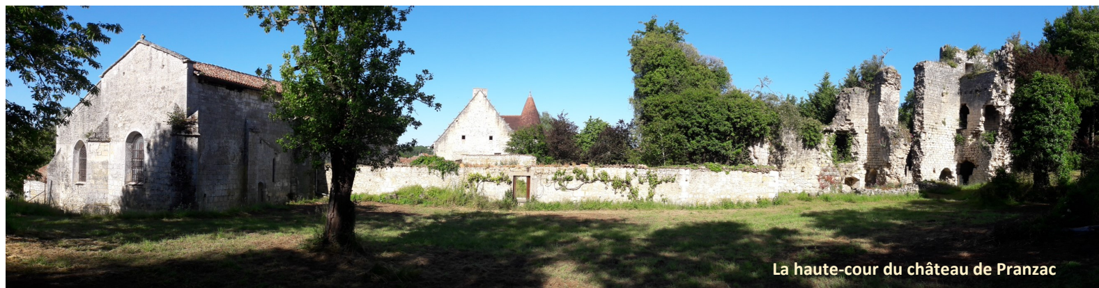
La haute-cour du château de Pranzac

La plateforme DARTAGNANS nous a permis de collecter des dons defiscalisables et grâce à la communication faite autour de ce projet de mobiliser de nouvelles forces vives de retraités de la restauration du bâti ancien.